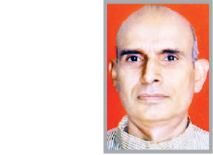
(लेखक स्वस्थ भारत, पंजी. व्याज के टेम्परलेब हैं, ये उनके अपने विचार हैं।)