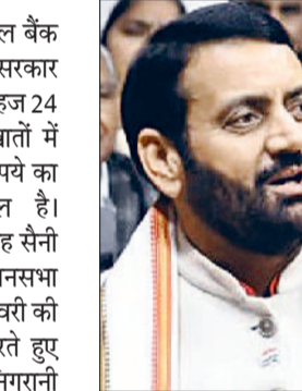
रकम को इधर-उधर ट्रांसफर किया

बताया गया है कि ये गड़बड़ी चंडीगढ़ स्थित दो बैंकों में हुई। आईडीएफसी फर्स्ट बैंक की चंडीगढ़ शाखा के अलावा यूटी के सेक्टर-32 के एयू स्माल फाइनेंस बैंक में यह गड़बड़ी सामने आई। प्रारंभिक तथ्यों के अनुसार कुछ कर्मचारियों ने सरकारी खातों से अनधिकृत और गलत तरीके से रकम को इधर-उधर ट्रांसफर किया। इस तरह की गड़बड़ियां आमतौर पर बैंकिंग सिस्टम में आंतरिक 'प्लेगिंग' से पकड़ में आती हैं, और इसी तकनीकी अलर्ट ने पूरे मामले का पर्दाफाश किया। आईडीएफसी फर्स्ट बैंक ने स्टॉक एक्सचेंज को सूचना देकर देना कि उसके कुछ कर्मचारियों ने सरकारी खातों में अनधिकृत तरीके से ट्रांजेक्शन किए हैं। बैंक ने चार सखिंध कर्मचारियों को तत्काल सस्पेंड किया।